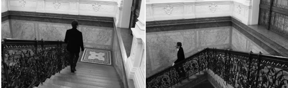
Fig.8 Under your climbing feet they will go on growing backwards - frames do video. Antigo Assicurazioni Generali palace em Wenceslas Square. 25 de novembro de 2019, Praga, República Checa (4:3, 19'00'', cor, c/som, loop).