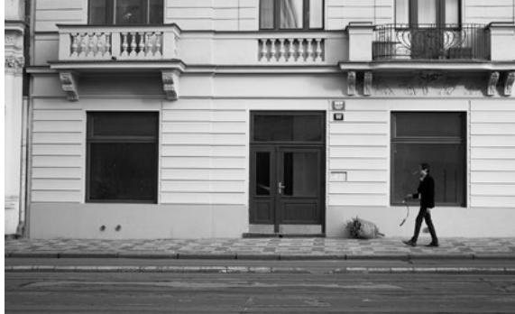
Fig.3 Dog Collar Walk . Fotografias. 22 de janeiro de 2020, Praga, República Checa. Duração: 1h. 51m. Adereços: Coleira e trela vermelha adulterada.