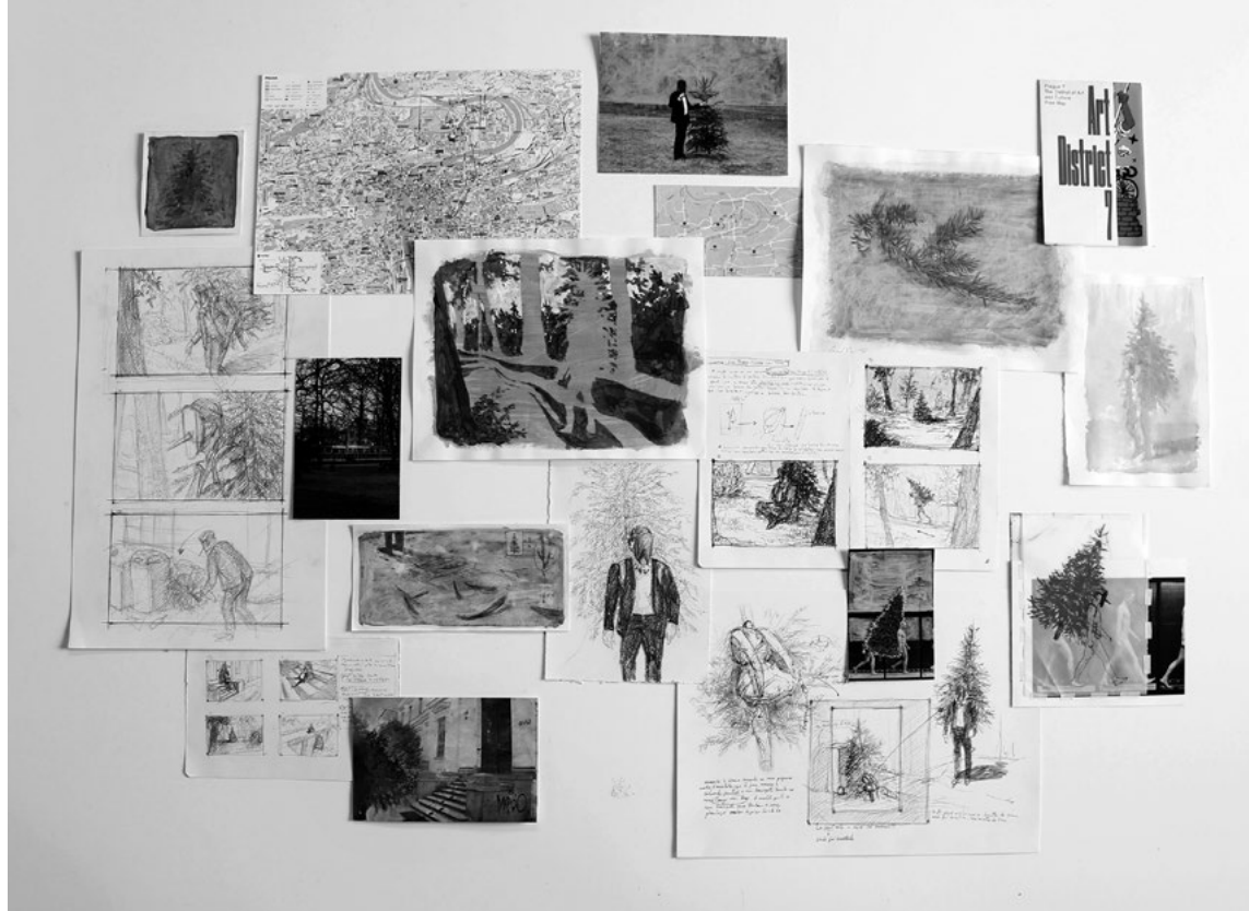
Fig.4 Carry (-) On Tree - Desenhos Protocolares, 2020. Técnica mista sobre papéis variados. Medidas variáveis.