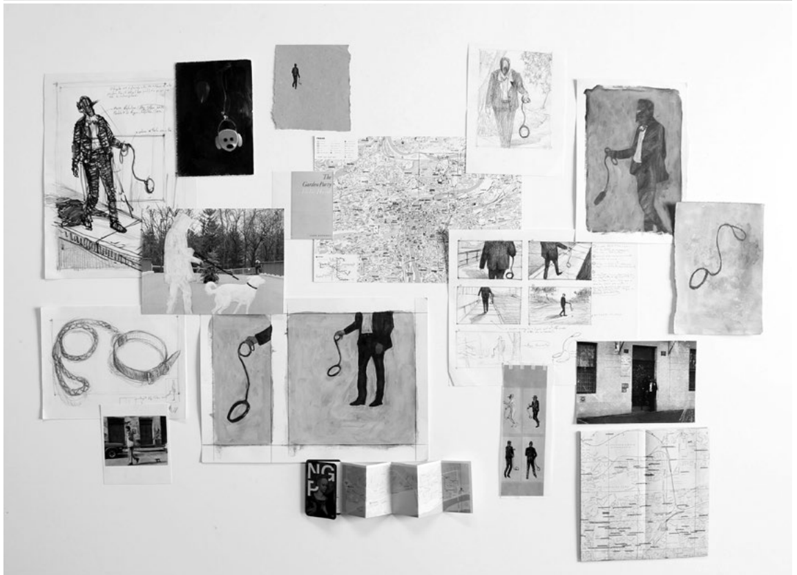
Fig.2 Dog Collar Walk - Desenhos Protocolares , 2020. Técnica mista sobre papéis variados. Medidas variáveis.