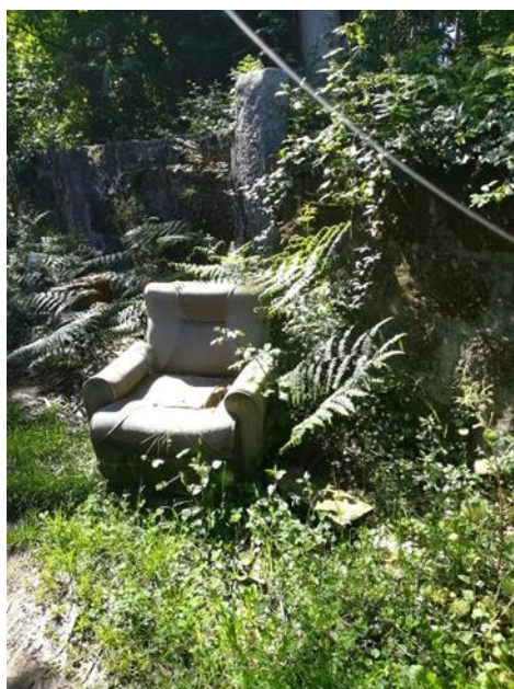
FIGURA 1 Resíduo de grande volume na entrada da floresta

A consciência ambiental sobre os impactos humanos na floresta da comunidade local foi demonstrada por todas as crianças. Logo no trajeto pedonal da escola para a floresta, as crianças manifestaram o seu descontentamento e crítica relativamente ao comportamento humano, pois encontraram vários objetos de grandes dimensões deixado por pessoas no meio de vegetação, como se pode ver na fotografia (Figura 1) tirada pelo Martim.