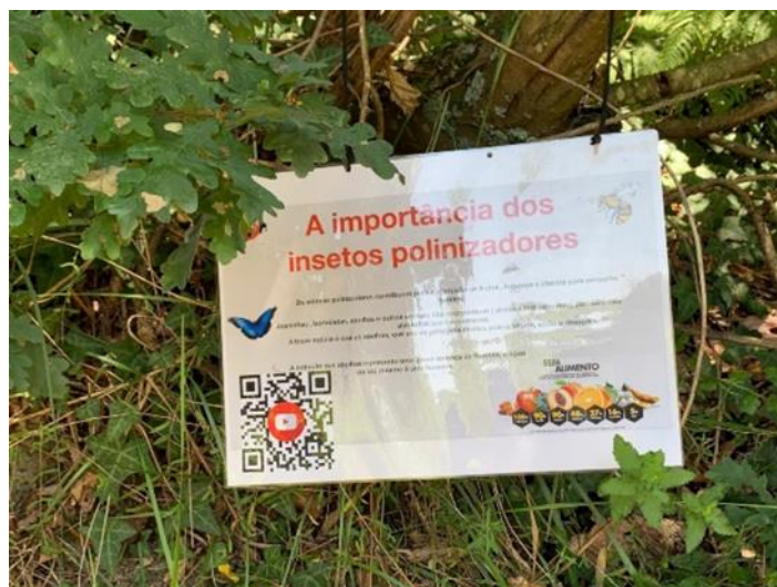
FIGURA 10 Cartaz do grupo “proteção do habitat de insetos polinizadores”