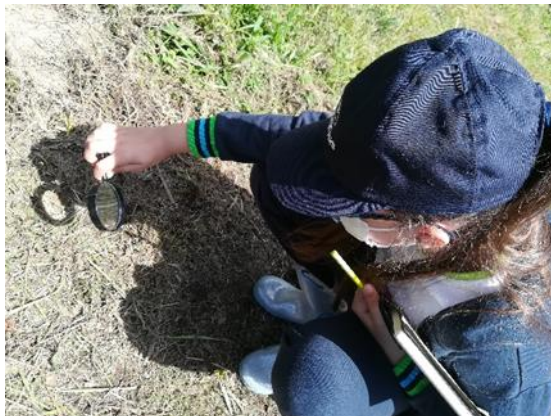
FIGURA 7 Observação com lupa