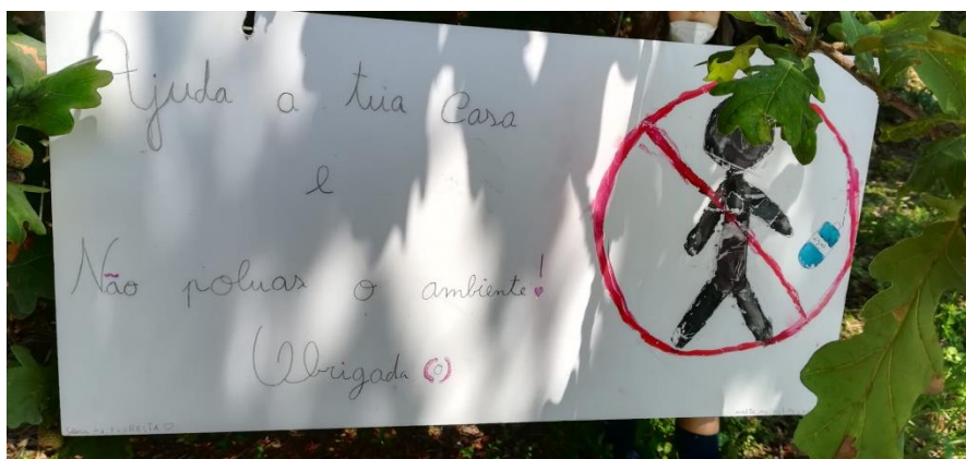
FIGURA 2 Cartaz I do grupo “proteção dos animais terrestres”