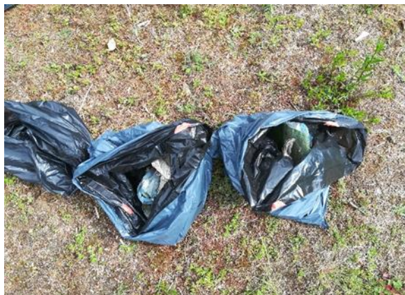
FIGURA 3 Sacos com lixo recolhido na floresta