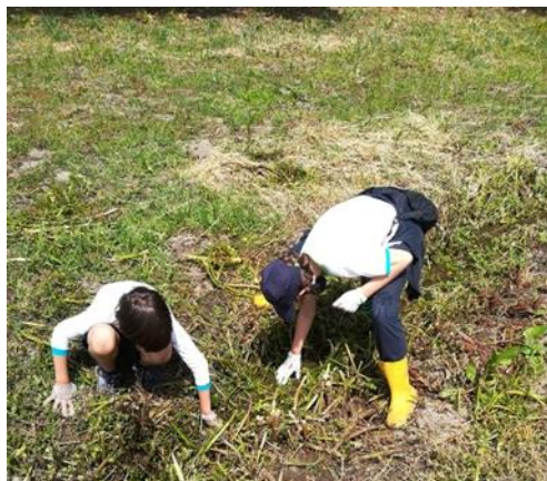
FIGURA 4 Recolha do lixo do riacho