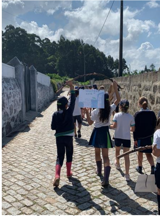
FIGURA 9 Manifestação