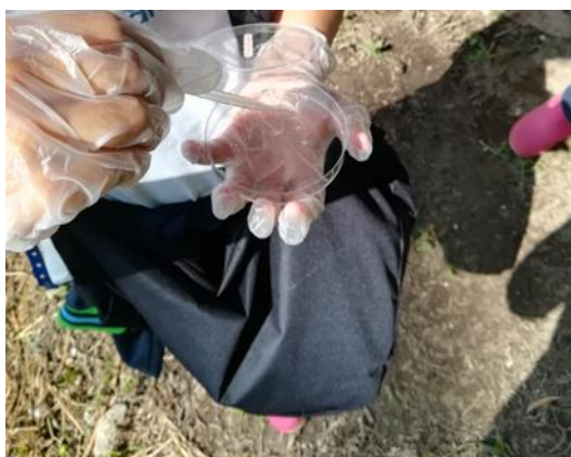
FIGURA 8 Recolha de amostra de água do riacho